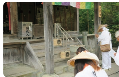
四国遍路のお寺に設置した 置き型手すり