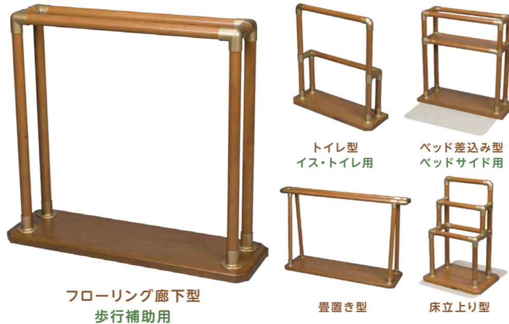
フローリング廊下型 歩行補助用