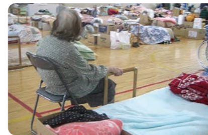
被災地のダンボールベッド用 手すり