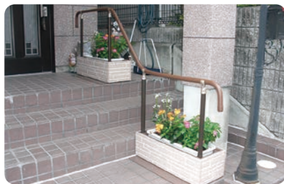
プランター型の 外部手すり