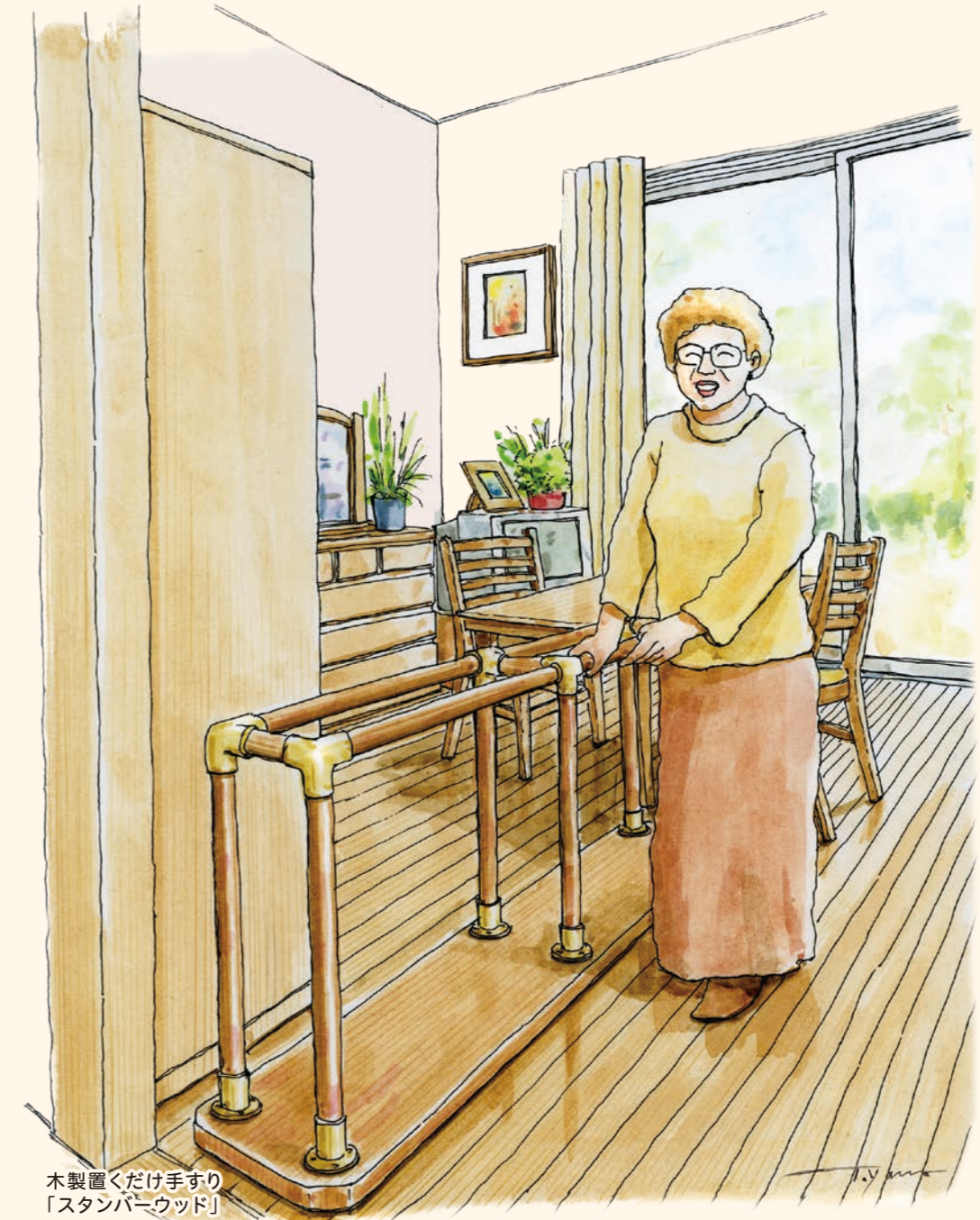
木製置くだけ手すり 「スタンバーウッド」